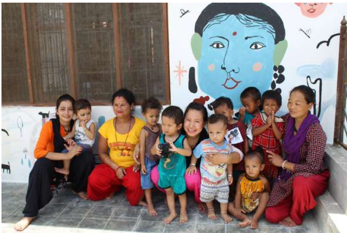
Sonrisas del Nepal.