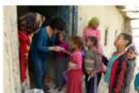
PROYECTO COMUNITARIO LUTAS BÉLICAS - AYUDA DE EMERGENCIAS SANITARIAS