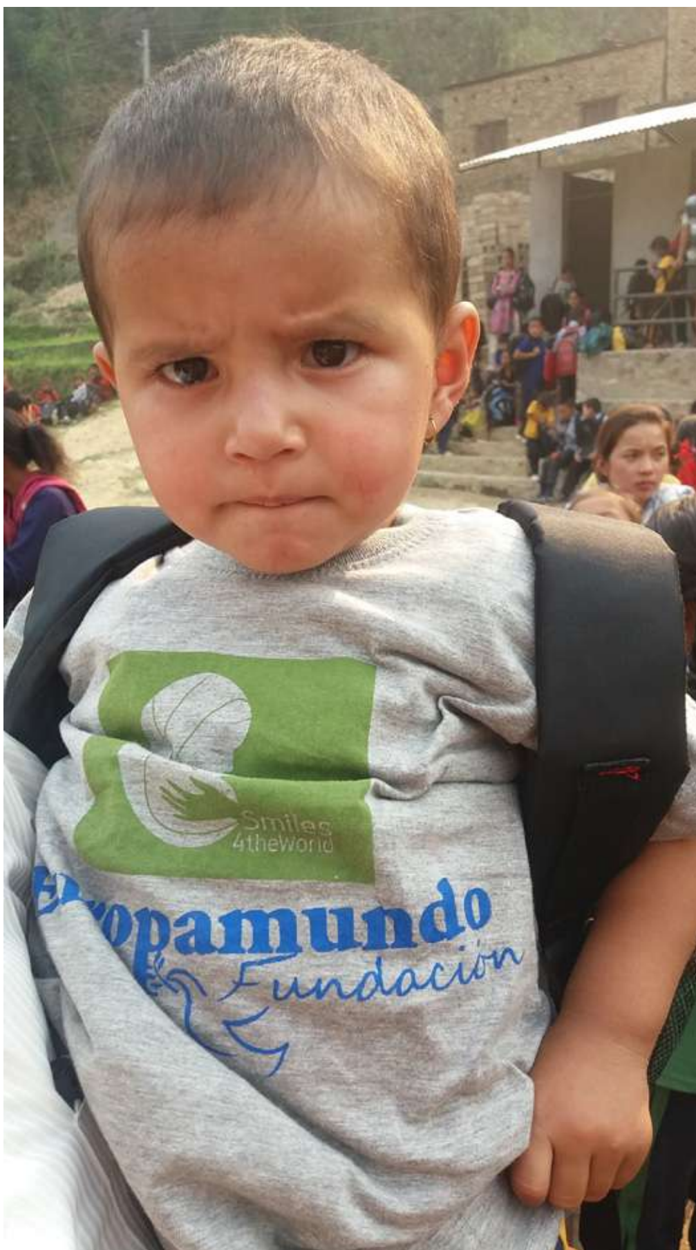
Sonrisas del Nepal