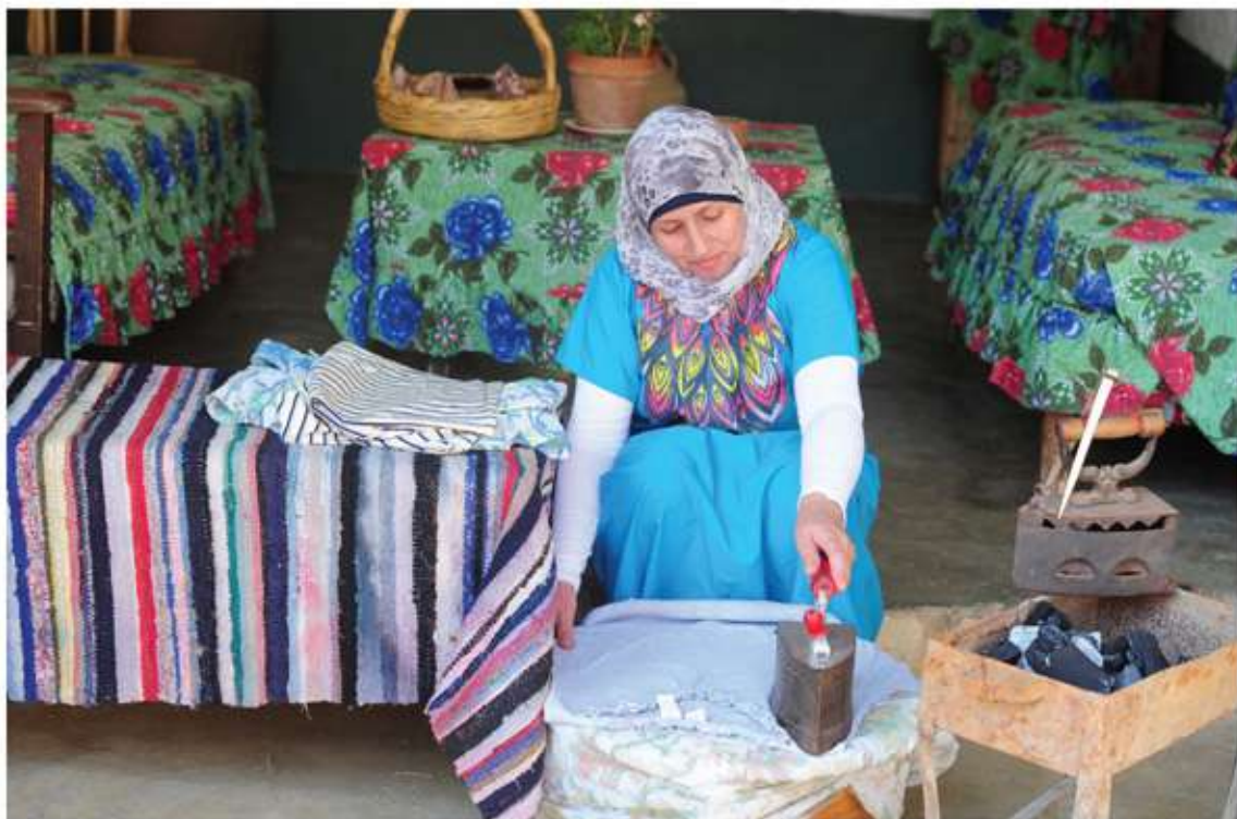
AIDA (LIBANO) - TURISMO SOSTENIBLE EN BEKAÁ