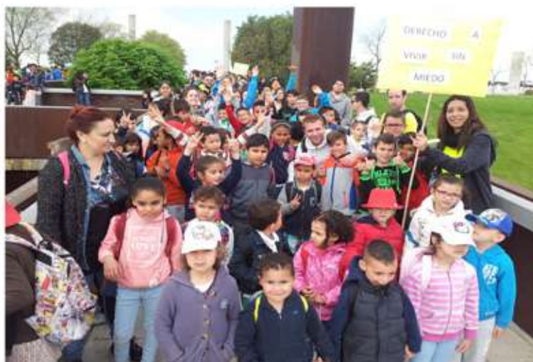
ASOCIACIÓN BARRÓ (VALLECAS - ESPAÑA) - CENTRO LÚDICO CHAPOTEA