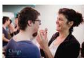
PROYECTO (MONTAÑA REPALE) - PROGRAMAS DE EMPLEO PARA PERSONAS CON DISCAPACIDAD