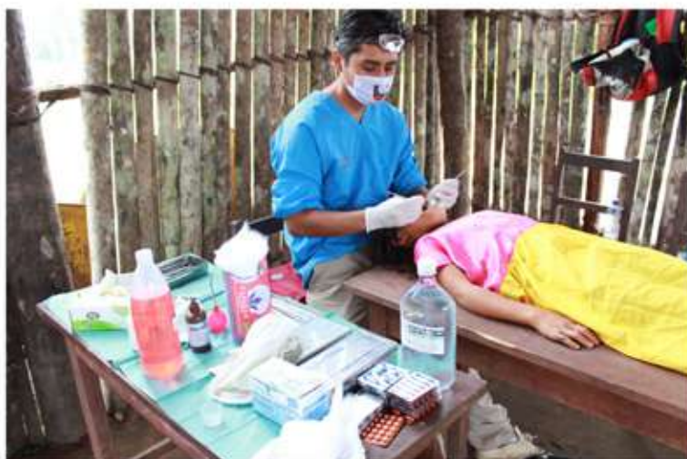
SOLIDARIDAD MÉDICA (RÍO MANIQUI - BOLIVIA) -PROYECTO SANITARIO

http://www.europamundo.com/fundacion/convocatorias.aspx