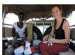
PROYECTO FERRARIETI (TUNISIA) - AYUDA SOCIAL