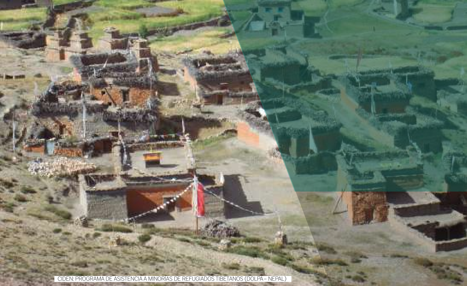
CIDEN: PROGRAMA DE ASISTENCIA A MINORÍAS DE REFUGIADOS TIBETANOS (DOLPA – NEPAL)