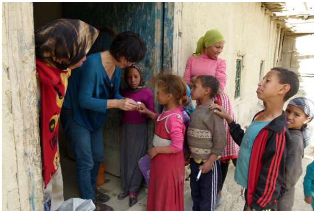
Pasos Cooperación: proyecto en Atlas Medio