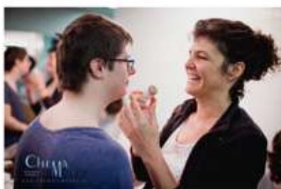
DAN ZASS (MADRID-ESPAÑA) DANZA Y TEATRO PERSONAS CON DISCAPACIDAD

También algunas de nuestras compañeras están realizando voluntariado en la ONG Dan Zass apoyando a los niños y niñas discapacitados que asisten a las clases de danza y teatro.