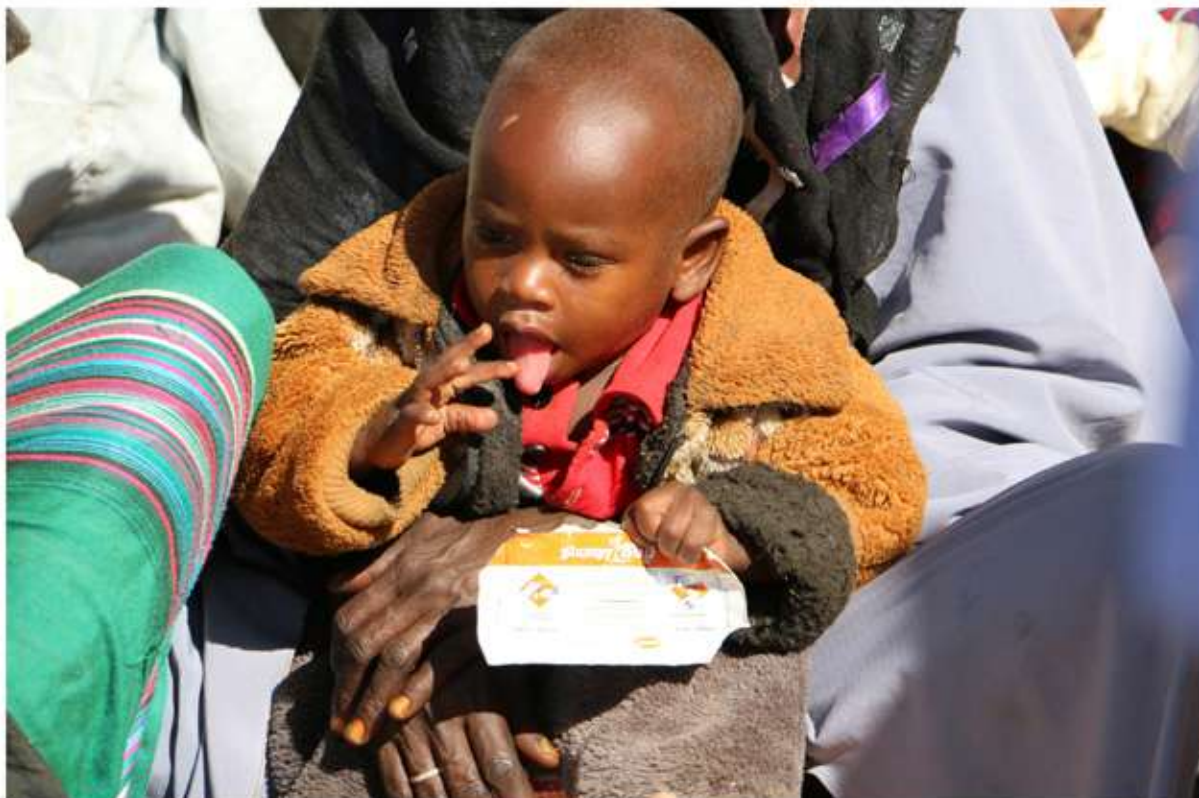
ACNUR - ETIOPÍA