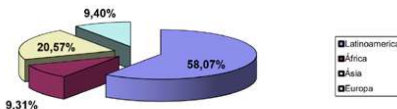
Importe de los proyectos por área geográfica