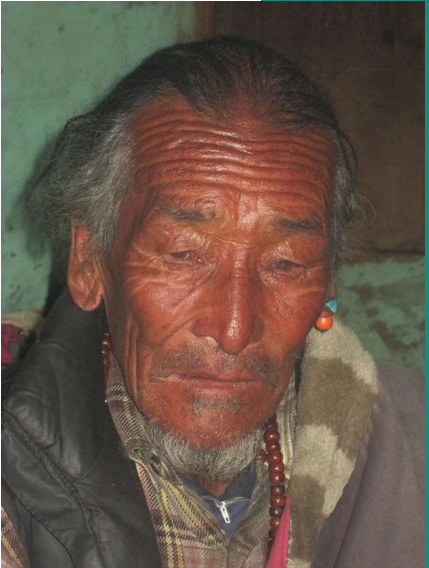
CIDEN: PROGRAMA DE REFUGIADOS TIBETANOS