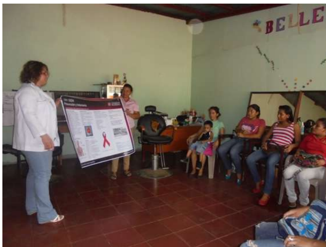
Pasos Cooperación: Proyecto en Managua