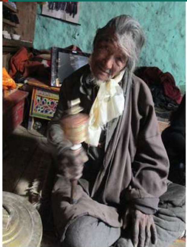
CIDEN (POKHARA -NEPAL) -PROGRAMA REFUGIADOS MINORÍAS TIBETANAS