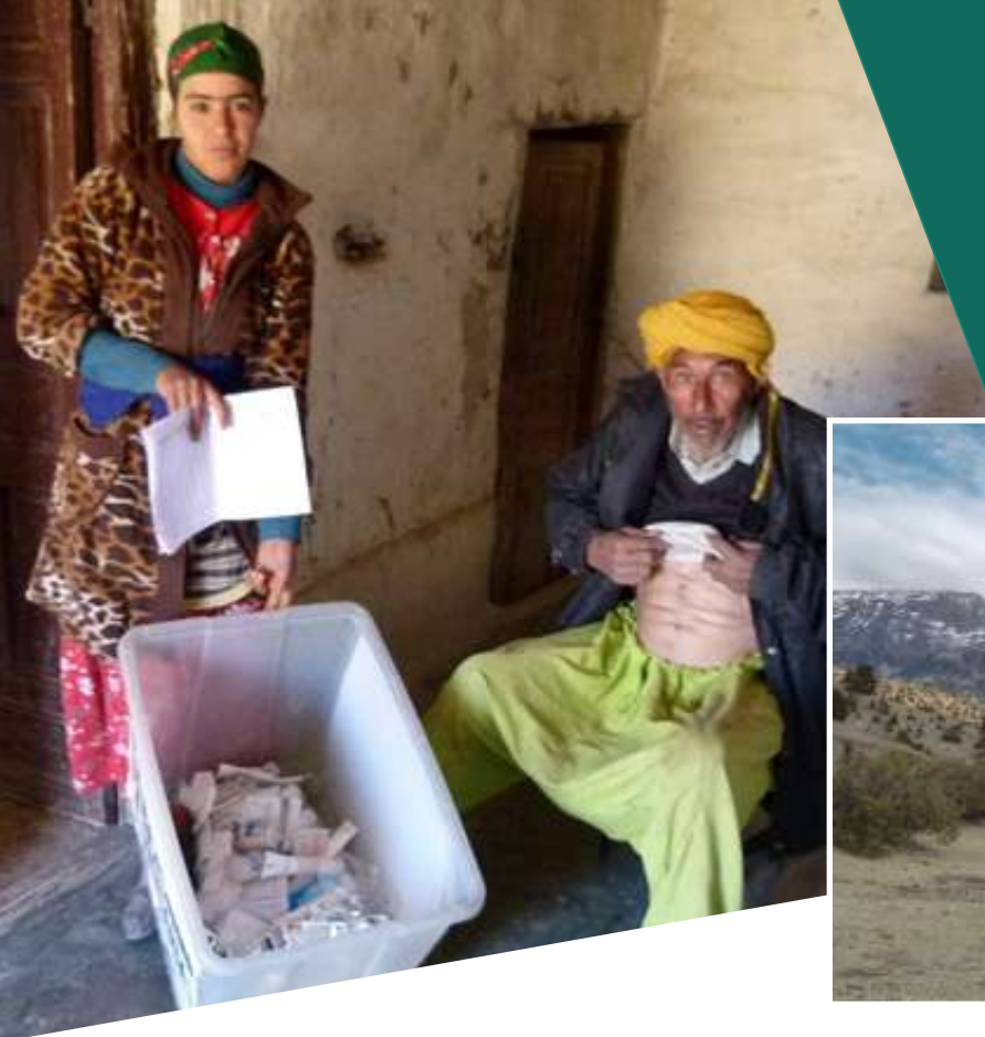
PASOS COOPERACIÓN: PROYECTO DE VOLUNTARIOS SANITARIOS EN EL ATLAS CENTRAL