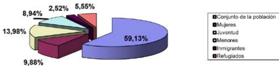
Importe de los proyectos por sector de la población