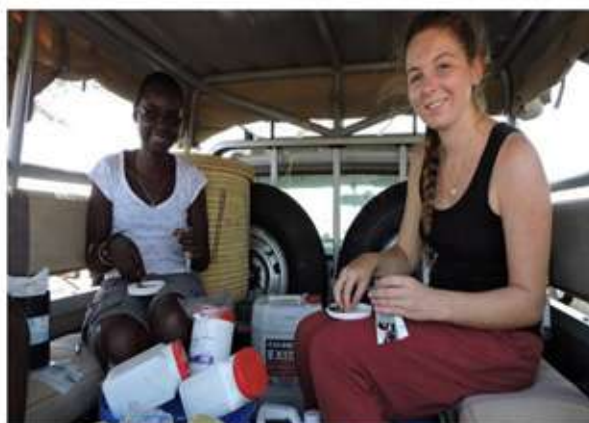
FUNDACIÓN EMALAIKAT (TURKANA - KENIA) - CLÍNICA MÓVIL