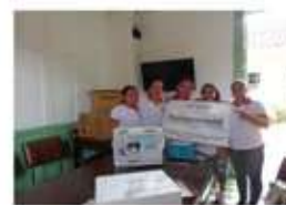
OPUS DE LECTIO DIVERSIÓN - VOLUNTARIADO EDUCATIVO