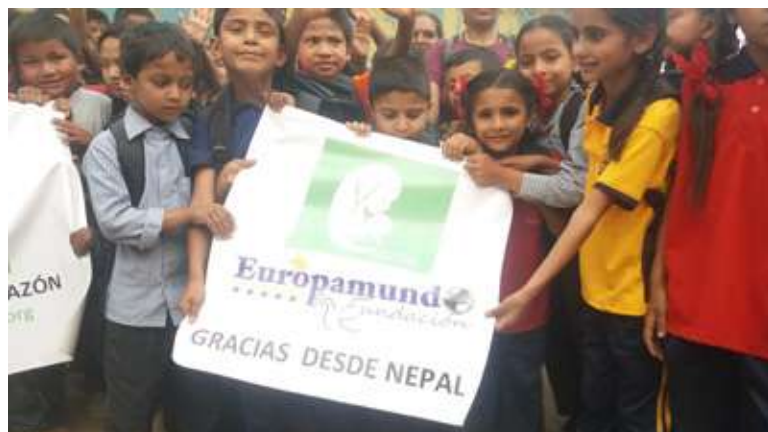
Sonrisas del Nepal