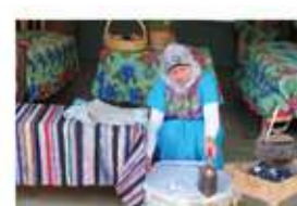
PROYECTO (MONTAÑA REPALE) - PROGRAMAS DE EMPLEO PARA PERSONAS CON DISCAPACIDAD