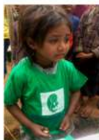
ASOCIACIÓN SONRISAS PARA EL NEPAL

A continuación se adjuntan algunas de las fotos de la exposición.