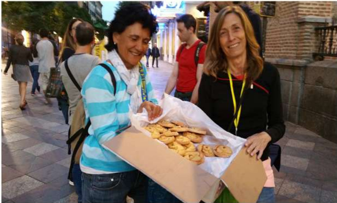
GRANITO A GRANITO (MADRID - ESPAÑA) - PROYECTO PARA PERSONAS SIN HOGAR