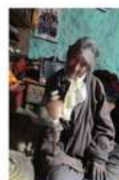
PROYECTO (MONTAÑA REPALE) - PROGRAMAS DE EMPLEO PARA PERSONAS CON DISCAPACIDAD