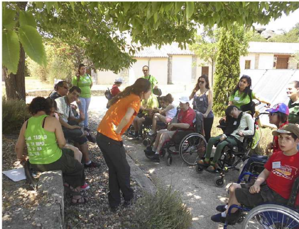
MASNATUR ( Madrid - ESPAÑA) Actividades de Apoyo a la Discapacidad