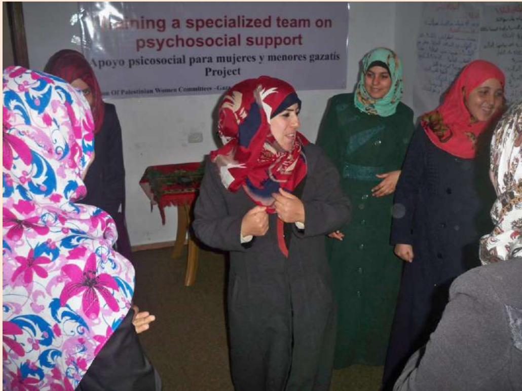
MUNDUBAT (FRANJA DE GAJA – PALESTINA) APOYO PSICOSOCIAL