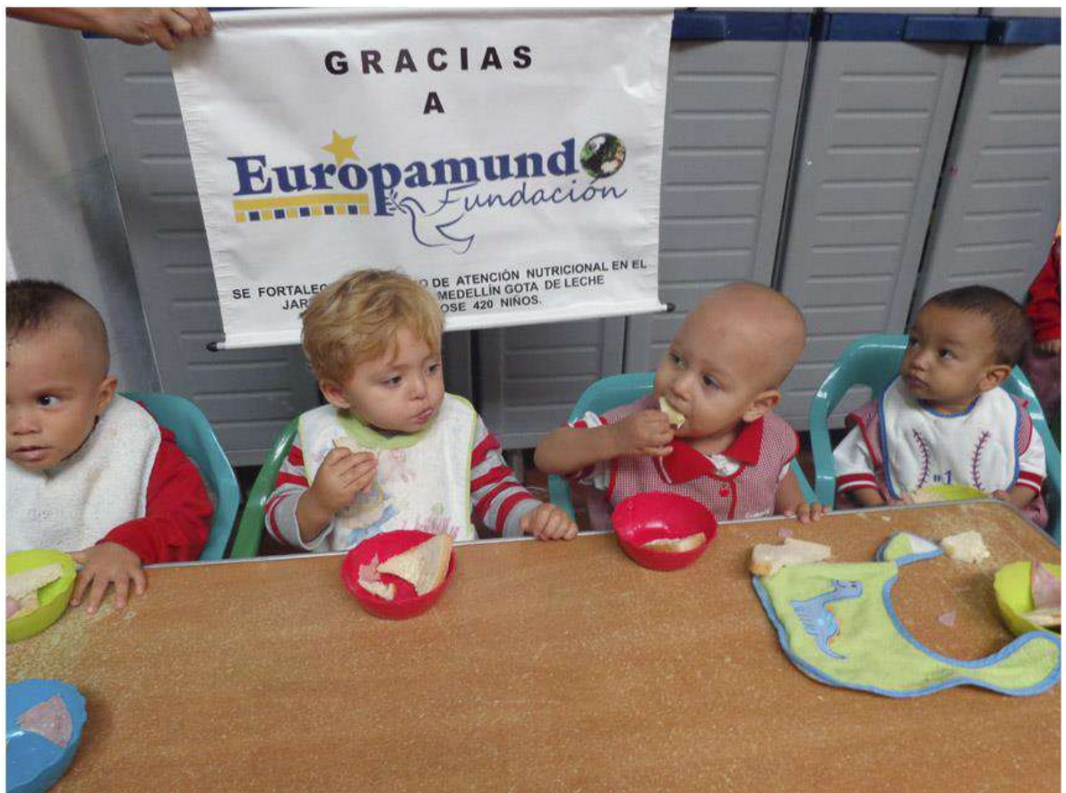
GOTA DE LECHE ( Medellín - COLOMBIA) Nutrición Base del Desarrollo Integral