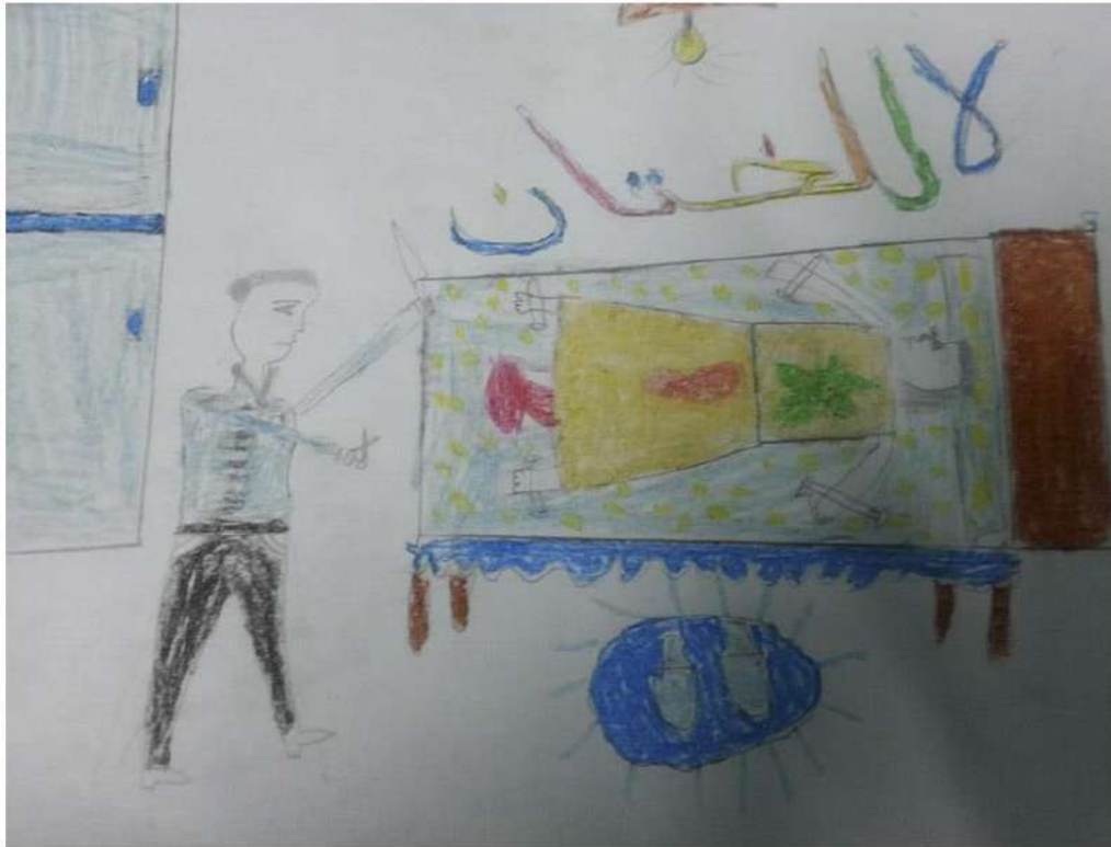
CONEMUND ( Dar El Salam- EL CAIRO - EGIPTO) Apoyo a Niñas Víctimas de la Mutilación Genital