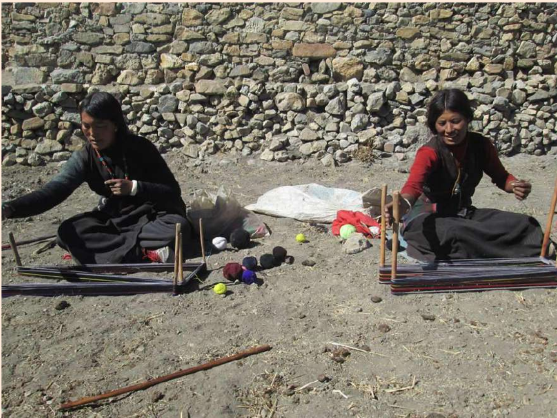
CIDEN ( UPPER DOLPA – NEPAL)