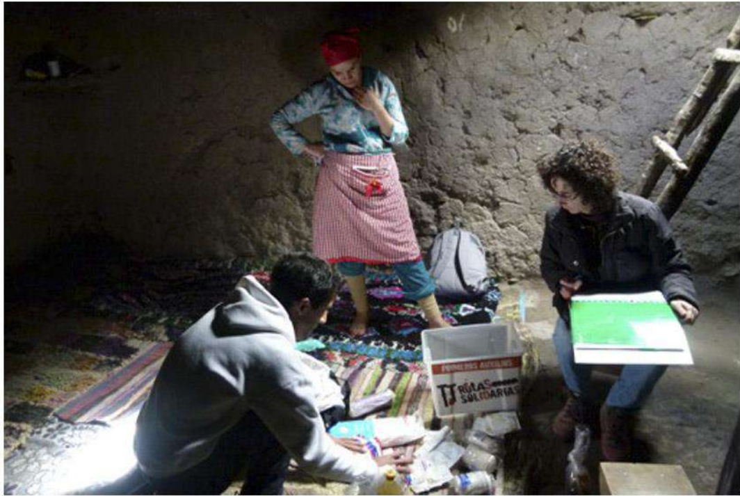
PASOS COOPERACIÓN (Atlas - MARRUECOS) Voluntarios Sanitarios