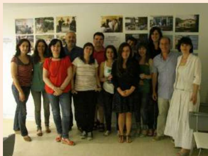
Algunos de los miembros de la Comisión de Valoración