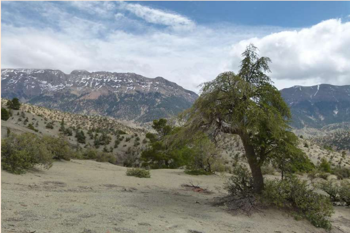
PASOS COOPERACIÓN (ATLAS – MARRUECOS)