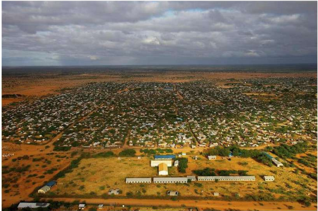
ACNUR ( Campo de Refugiados Dadaab - KENIA)