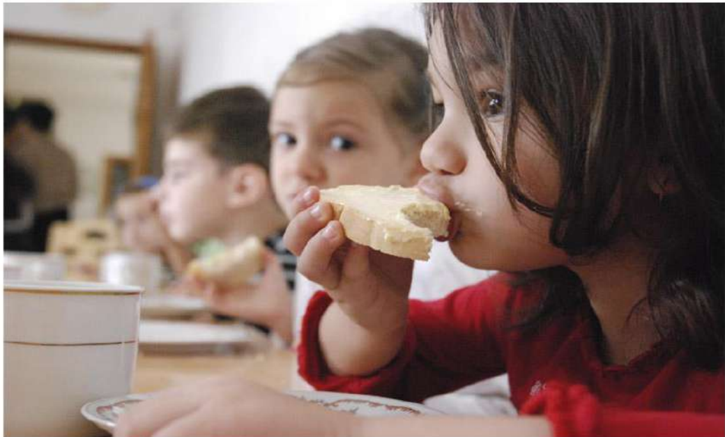
ALDEAS INFANTILES ( Madrid - ESPAÑA) Becas Comedor