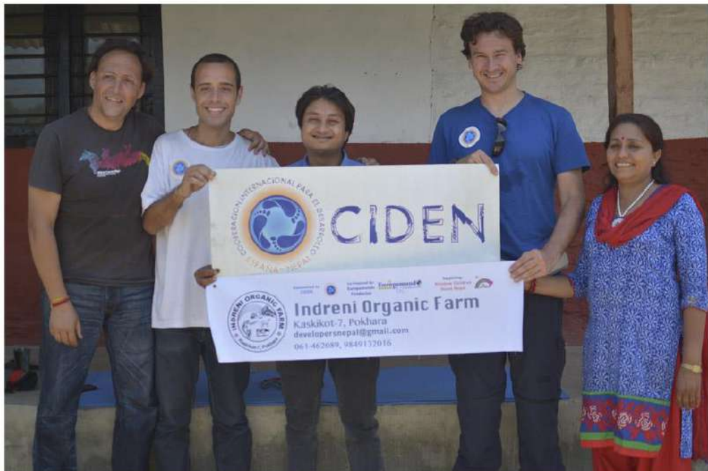
CIDEN ( Pokhara - NEPAL) Turismo Solidario