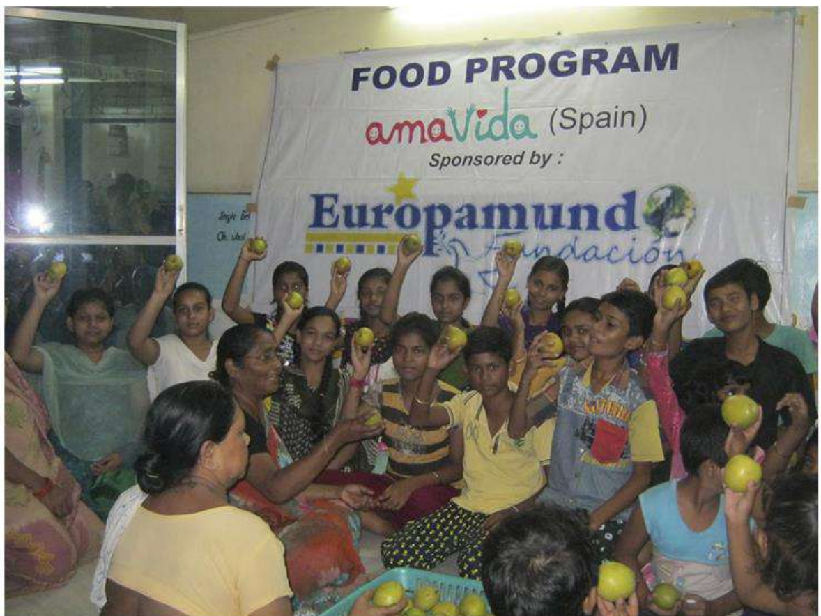
AMAVIDA (Calcuta- INDIA) Food Program