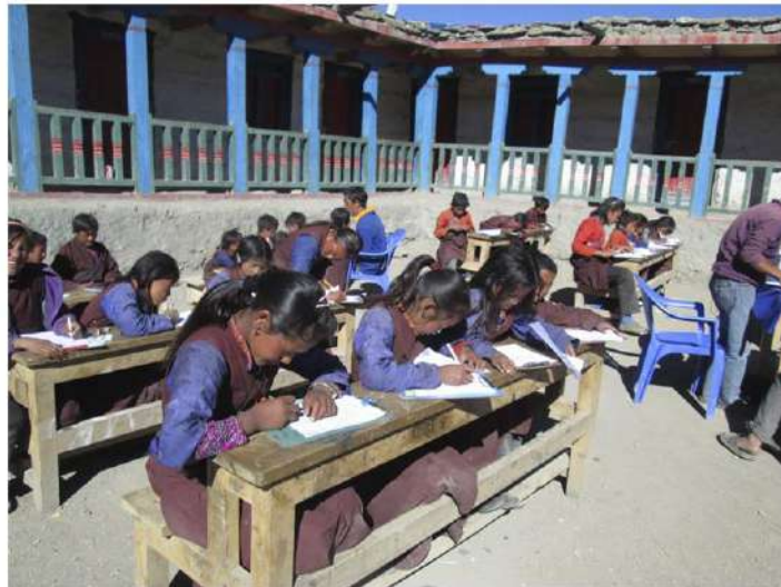
CIDEN (Kolang - NEPAL) Apoyo a la Educación

La Comisión de Valoración formada a instancia del Director General de Europa Mundo Vacaciones S.L. (EMV) fue la responsable de seleccionar, entre todos los proyectos recibidos, los beneficiarios del Fondo 2014 de la Fundación Europamundo y financiados en el 2015.